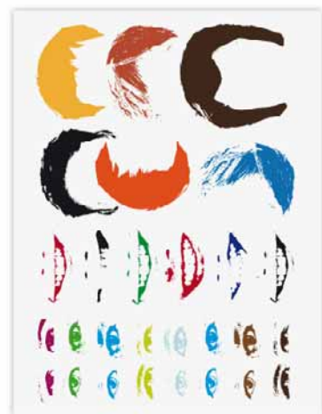
//////// Stickers Kinder ///// adhésifs - Formats variables - 2010