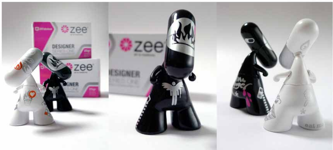
//////// Toys designer "Eat me" et Fetich" une serie produite par CharacterStation / suisse. Une série limitée à 1111 pièces /////