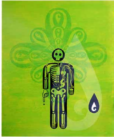
//////// Human Body* ///// Acrylique, encre de chine et vernis sur canvas - 60x80cm - 2006