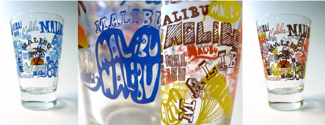
//////// "Caribbean Graffiti" Série limitée de 2 verres Malibu Customisés pour les fêtes de fin d'année. /////