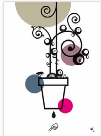
//////// My Botanical Garden series ///// Impressions numériques sur Rive - 50x70cm - 2010