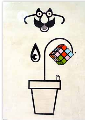
//////// Small Player ///// Acrylique, encre de chine et vernis sur canvas 50x70cm