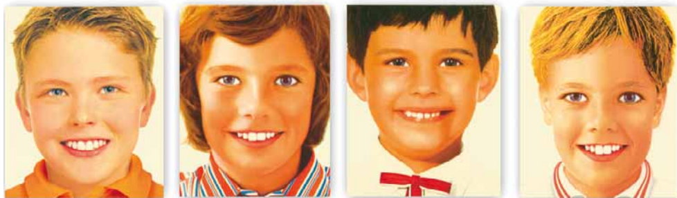
//////// Kinder Serie_01 ///// Impressions sur bois - éditée à 1ex serie de 4 visages - 50x70cm - 2010